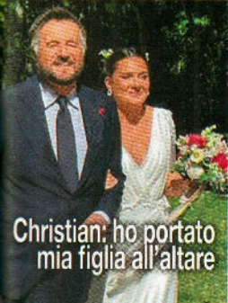
Christian: ho portato mia figlia all'altare